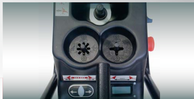
Console di comando