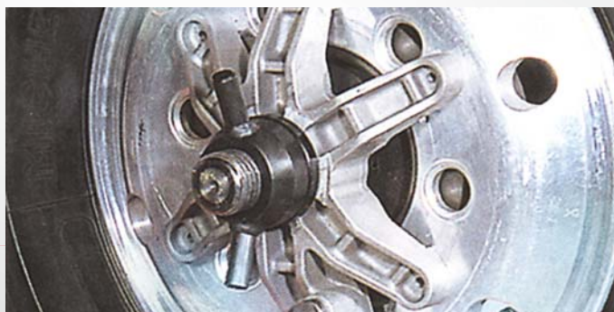
Gruppo adattatore (220-280 mm Ø)