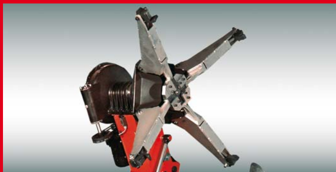
Amplissima gamma di bloccaggio Da 14" a 58" senza prolunghe, con griffe lunghe per cerchioni a offset elevato (per serie King 58).