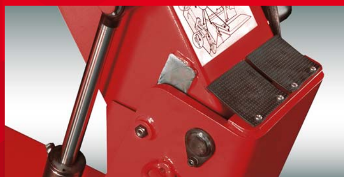
Disegno speciale Perni regolabili che assicurano una lunga durata della cerniera del braccio mandrino.