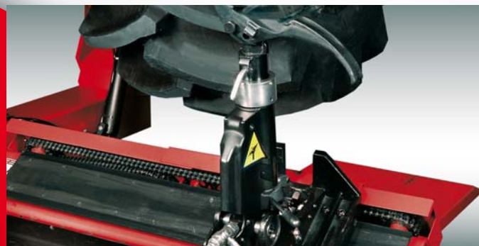
Utensile di montaggio Può ruotare indipendentemente dalla posizione del braccio.