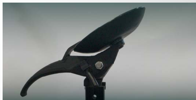
Disco stallonatore Dotato di uno speciale sistema basculante per aumentare la forza di stallonatura e assicurare che il disco sia sempre nella posizione ottimale rispetto al cerchione.