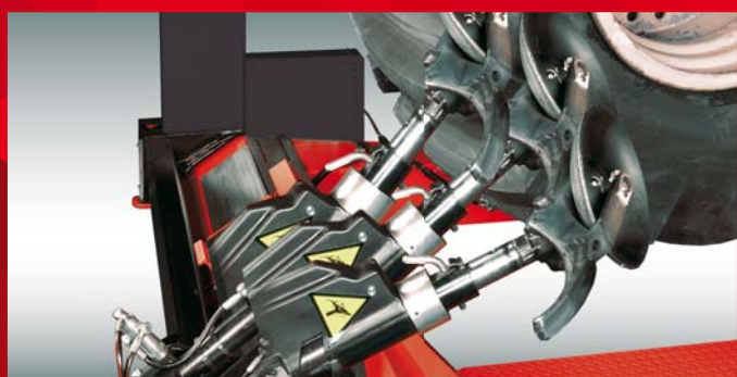
Traslazione idraulica del carrello porta utensile.